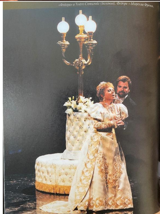
«Федора» в Teatro Comunale (Болонья). Федора – Мирелза Френи.